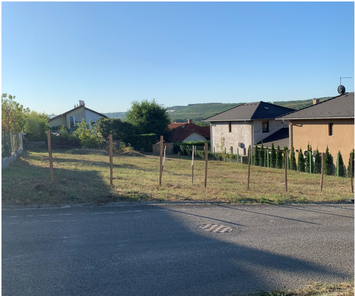
3. kép: Fotó az 1590/36 hrsz. ingatlanról