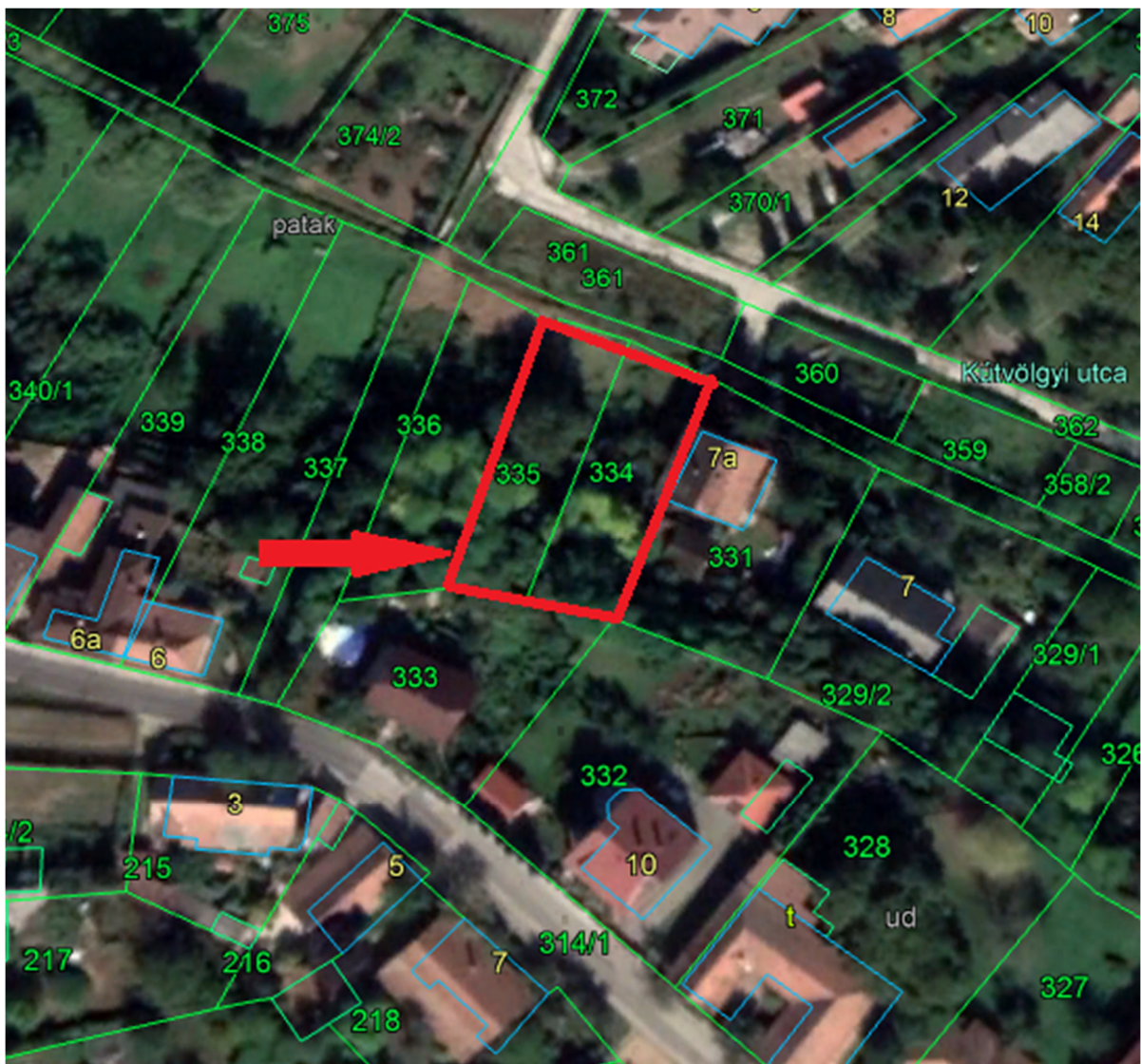
334 és a 335 hrsz. ingatlanok HÉSZ kivonata, Google műhold térképe

A tulajdonostárs, a stone dekor Kft. 2020. február 14-én benyújtotta ajánlatát mindkét ingatlan tulajdonrészére. Ajánlatához melléklete az adásvételi szerződést-tervezetet is. Figyelmüket elkerülte, hogy a felhívás nettó 700.000 Ft összegről szólt. A Műszaki iroda telefonon tájékoztatta erről a Kft-t. E szerint módosítják ajánlatukat és az adásvételi szerződés tervezetét is.