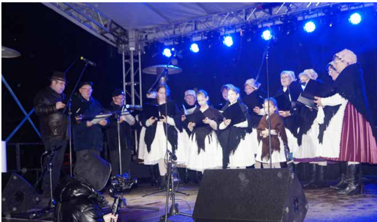
Nagy tapsot kapott a Jakab Mihály Népdalkör fiatalokkal erősített ünnepi műsora