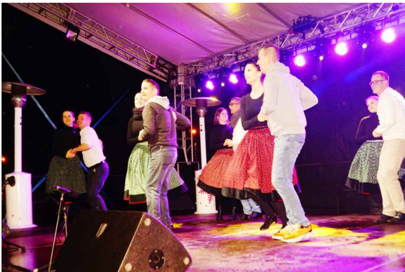
A Karikás Táncgyűttes fellépése vidámságot hozott a Főtérrre a zord időjárás ellenére