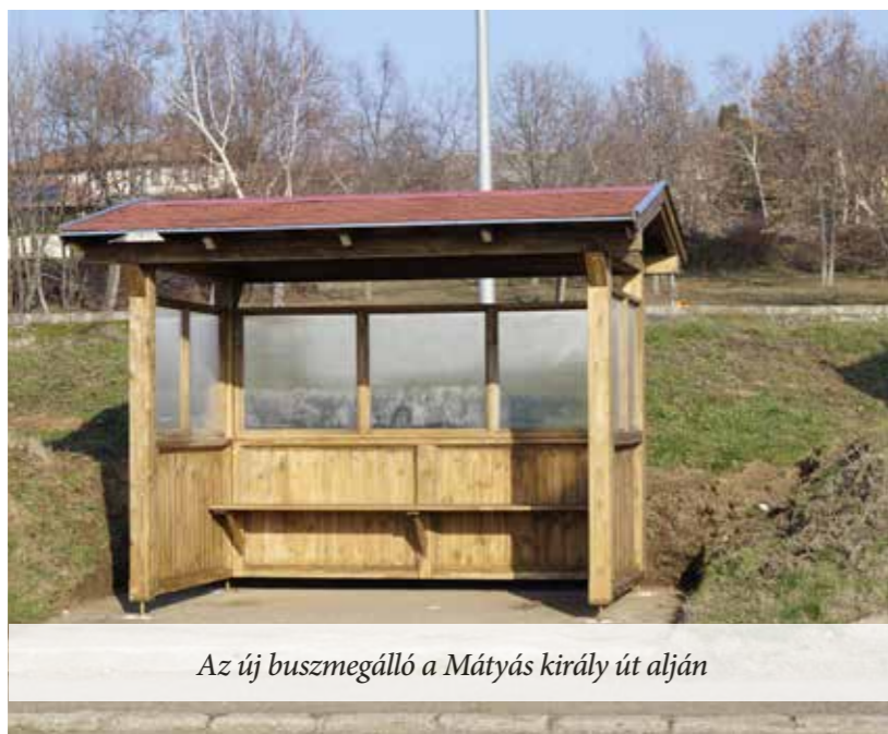
Az új buszmegálló a Mátyás király út alján