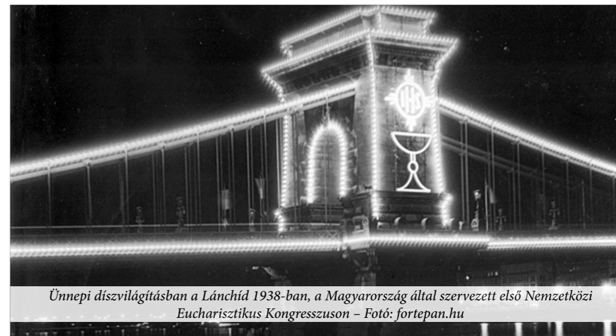
Ünnepi díszvilágításban a Lánchíd 1938-ban, a Magyarország által szervezett első Nemzetközi Eucharisztikus Kongresszuson

Annak gondolata, hogy Budapest is rendezzen eucharisztikus világkongresszust, már Csernoch János és kíséretének Chicagóból való hazatérte után felvetődött. Mintegy próbaként 1928-ban nemzeti eucharisztikus kongresszust tartottak Magyarországon, kétszázezer hívő részvételével. Ennek sikerén felbuzdulva a püspöki kar a következő évi értekezletén hivatalosan is kezdett tárgyalni arról, hogy Magyarországon is tarthassanak eucharisztikus világkongresszust. Az 1929. március 13-i püspökkari értekezleten az új esztergomi érsek, Serédi Jusztinián szorgalmazta a budapesti helyszínt és ki is jelölte az időpontot, mégpedig 1938-at, Szent István halálának 900. évfordulóját. A hercegprímás alkalmasnak látta a magyar katolicizmust arra, hogy az egész világ előtt szerepeljen egy ilyen rendezvény keretei között.