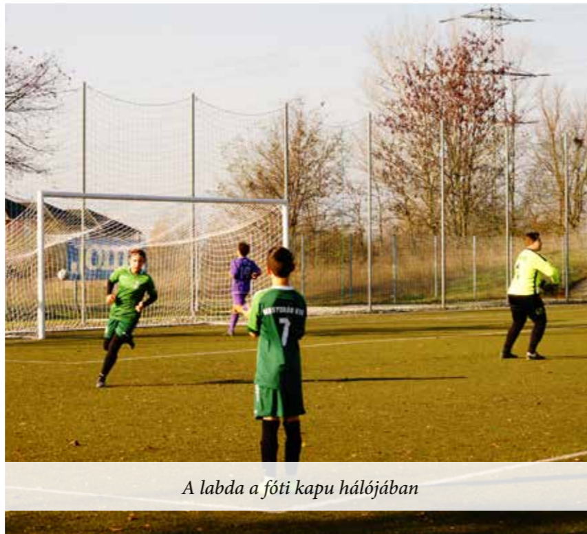
A labda a fóti kapu hálójában