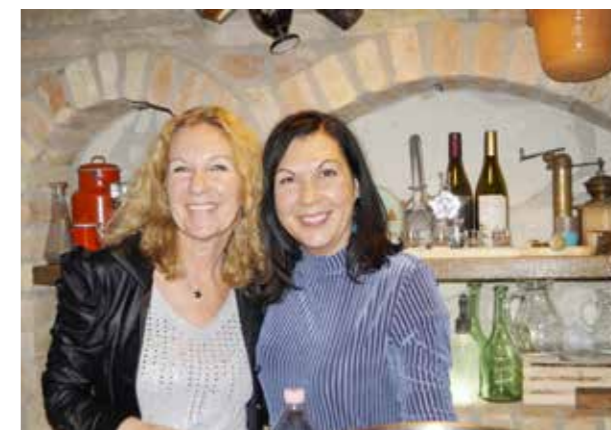
Vidám vendéglátók fogadták a betérőket