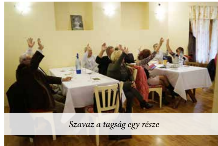
Szavaz a tagság egy része