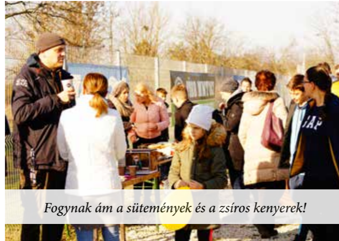
Fognak ám a sütemények és a zsíros kenyerek!