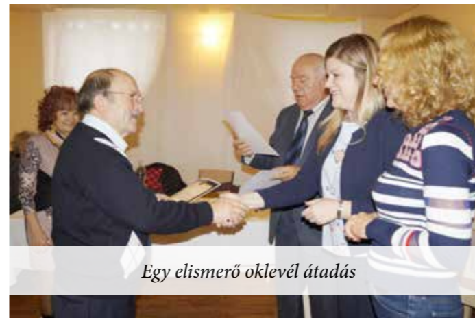
Egy elismerő oklevél átadás