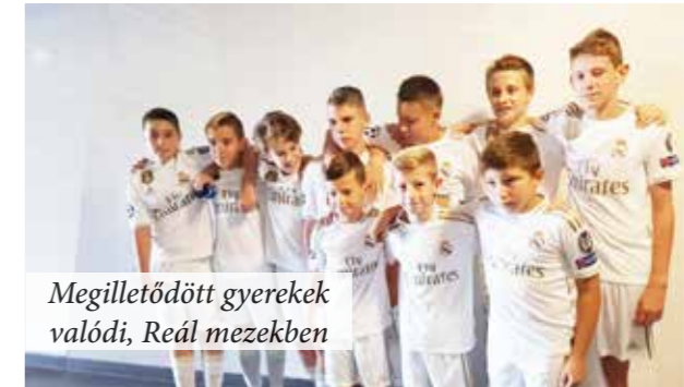
Megilletődött gyerekek valódi, Real mezekben

Meghívásra ott voltunk 22 gyerkőccel az Uruguay-i válogatott nem nyilvános edzésén, melyet a srácok tátott szájjal figyeltek, ami után lehetőség nyílt közös fotók ké-