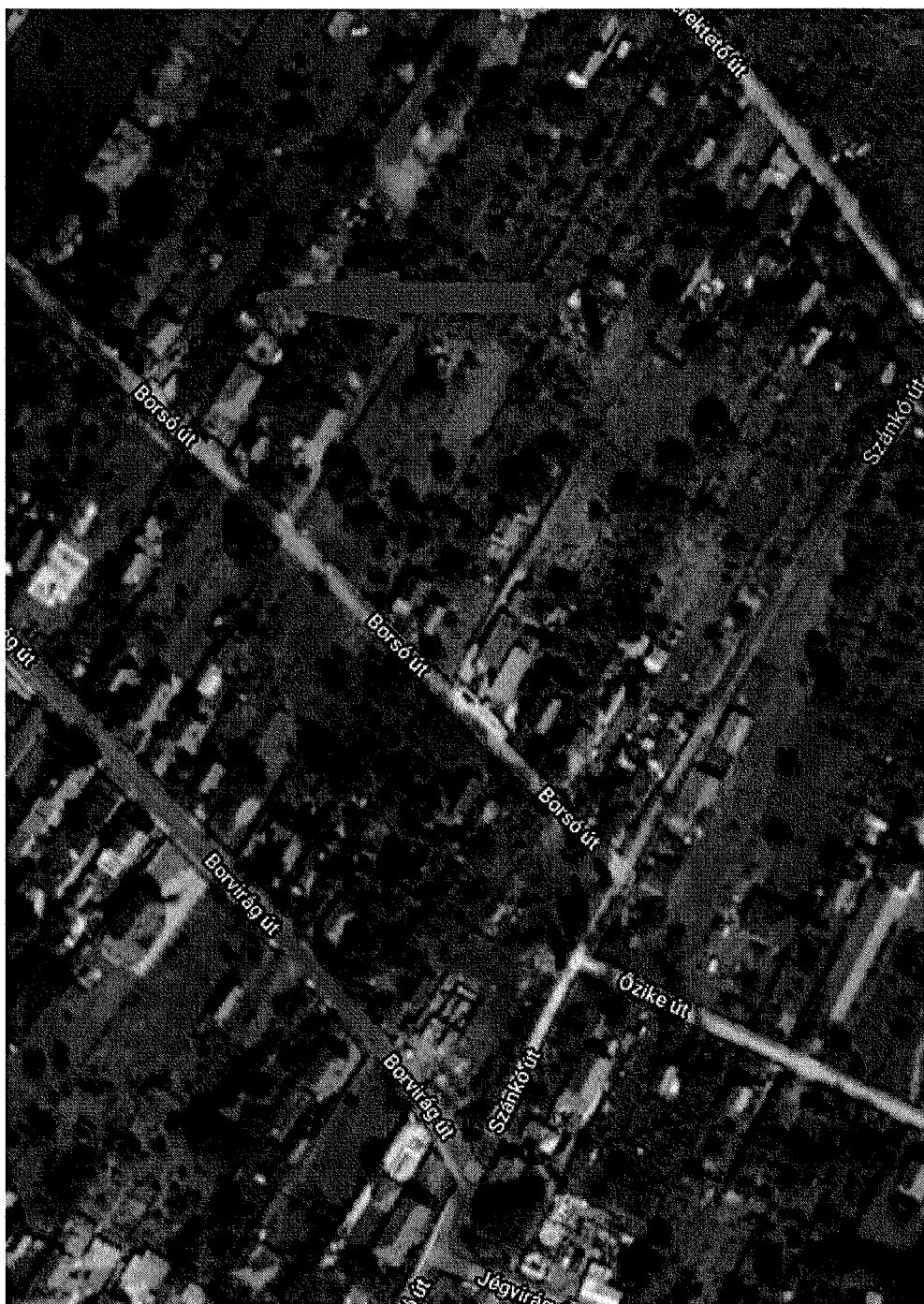
A 2493 hrsz. ingatlan Google Maps kivonata

Ezért a jelen ülésen csak arról tud dönteni a T. Képviselő-testület, hogy az ajánlattal kíván-e érdemben foglalkozni a további kiadások megelőzése érdekében.