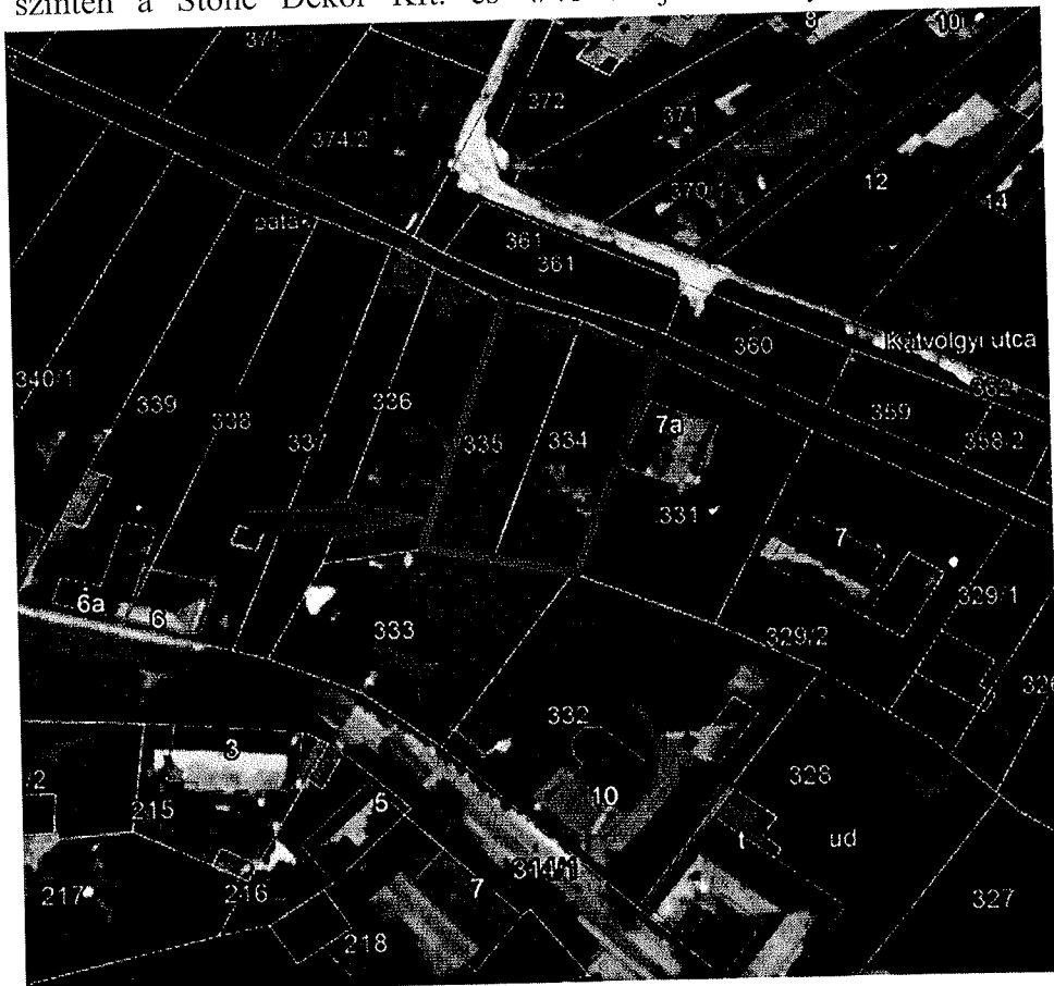
Önkormányzat a tulajdonos.334 és a 335 hrsz. ingatlanok HÉSZ kivonata, Google műhold térképe

arányban szintén a Stone Dekor Kft. és 4/48 tulajdoni hányadban pedig szintén az