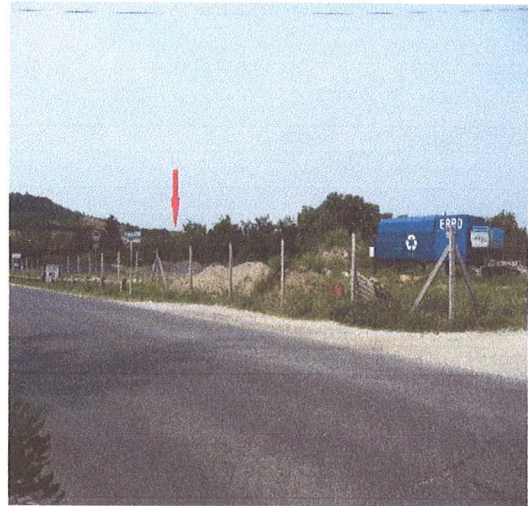
Fotók a 602, 603/7 és a 603/8 hrsz. ingatlanokról