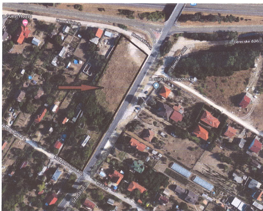
A 602, 603/7 és a 603/8 hrsz. ingatlanok műhold térképe