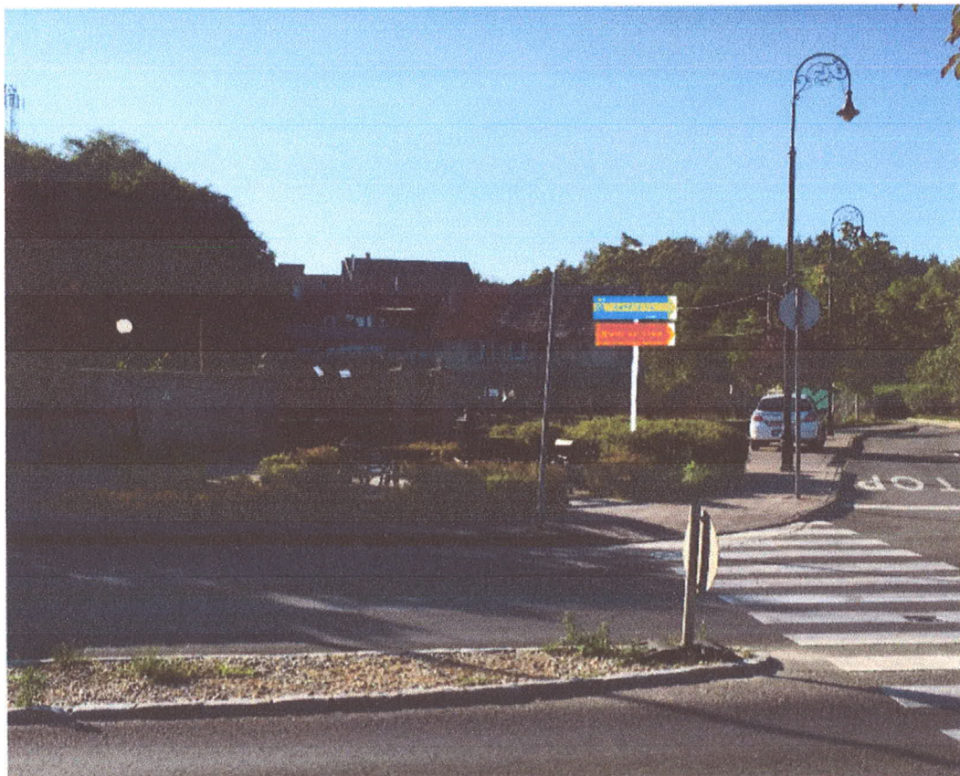
2. ábra Rózsa utca 2-4. szám előtti parkban