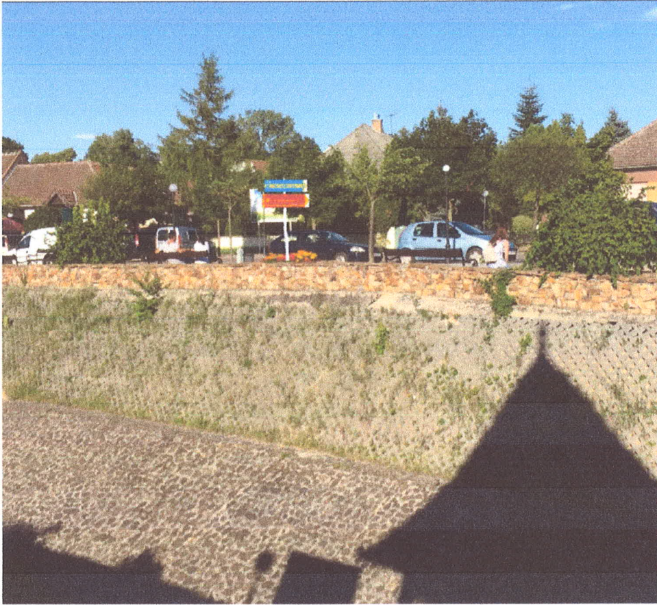
1. ábra Fő tér Dózsa György úti részének egyik cserjével be nem ültetett "virágládájában"