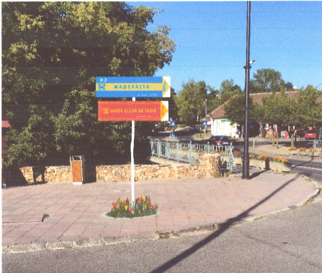
3. ábra Rózsa utca Fóti út sarkon lévő virágbolt előtt