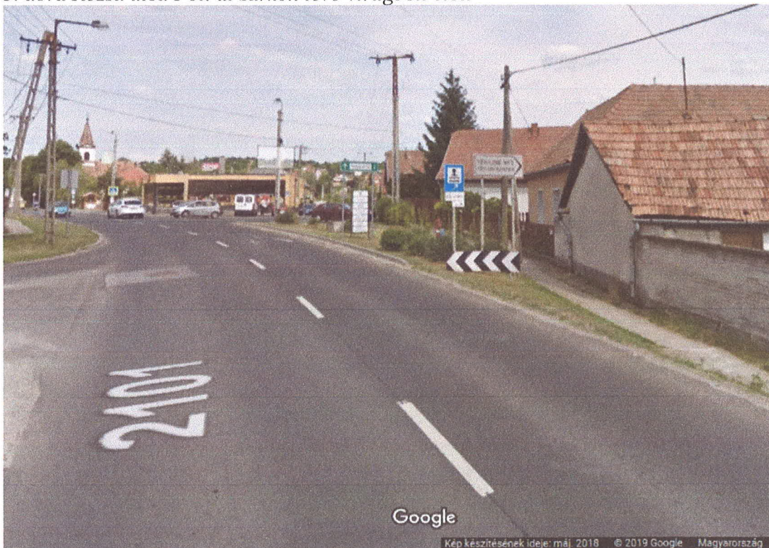
4. ábra "Mázsa tér" meglévő KRESZ és útbaigazító táblák