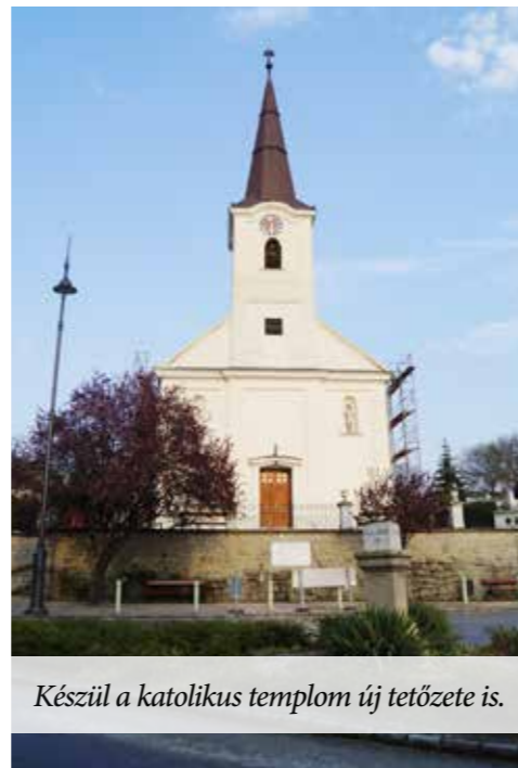
Készül a katolikus templom új tetőzete is.

Pályázataink, eredményeink, folyamatban levő beruházásaink Mogyoród Lakosságát szolgálják.