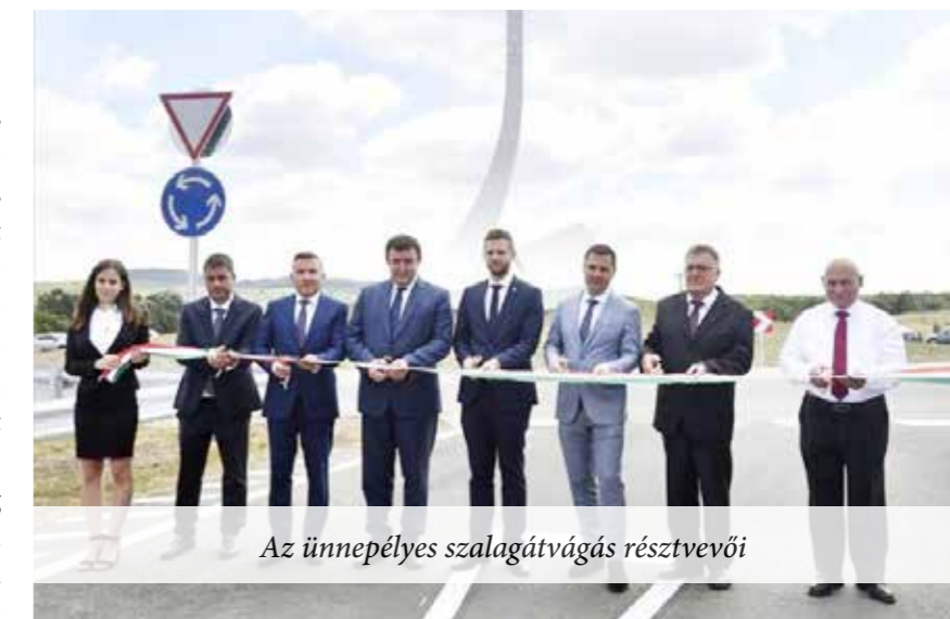
Az ünnepélyes szalagátvágás résztvevői