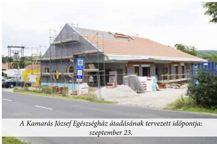
A Kamarás József Egészség ház átadásának tervezett időpontja: szeptember 23.

a Madéfalvi testvértelepülésünk vendéglátása a Szent László Hét rendezvénysorozaton címmel;