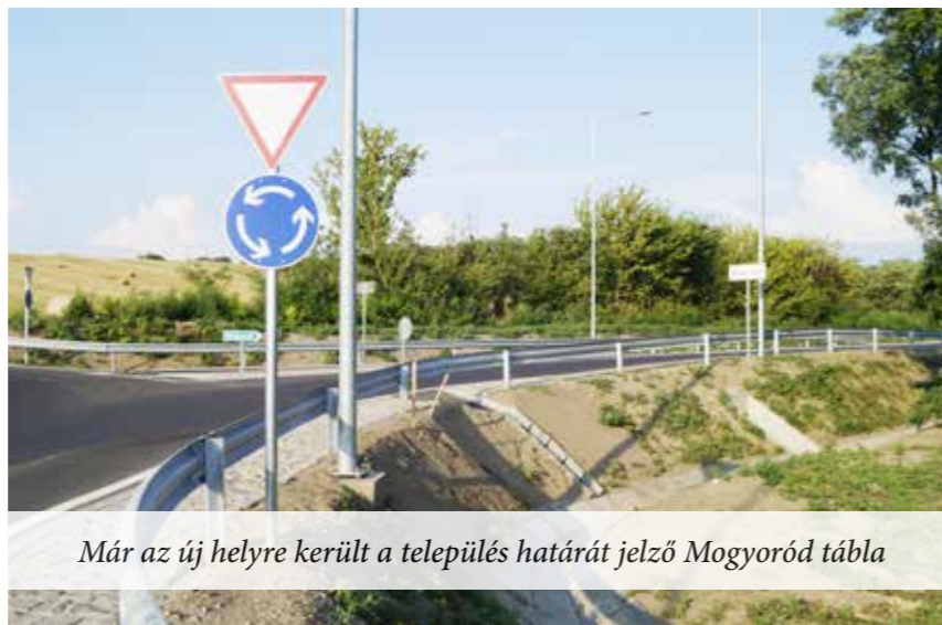
Már az új helyre került a település határát jelző Mogyoród tábla