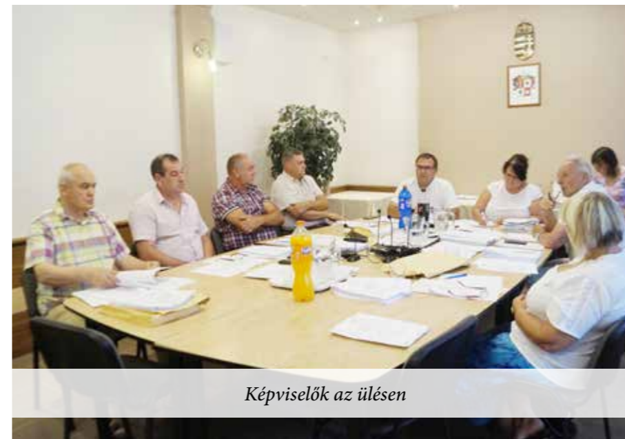
Képviselők az ülésen

225. Et. A 2818 hrsz. Galamb utcai bérleti díjának felülvizsgálata