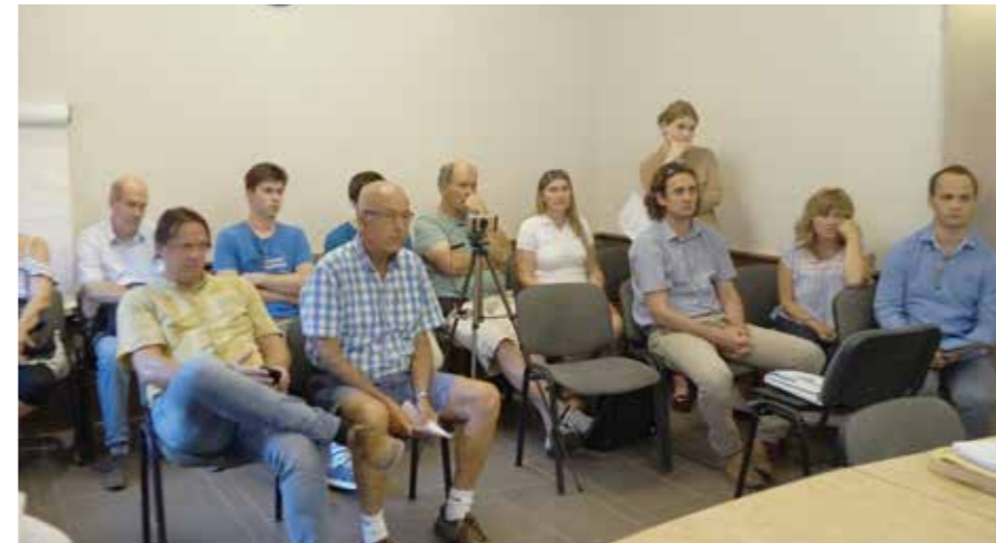
A Radnóti út és a Radnóti köz lakói az ülésen

A képviselők úgy döntöttek, hogy az ingatlan pályázat útján kívánják értékesíteni.