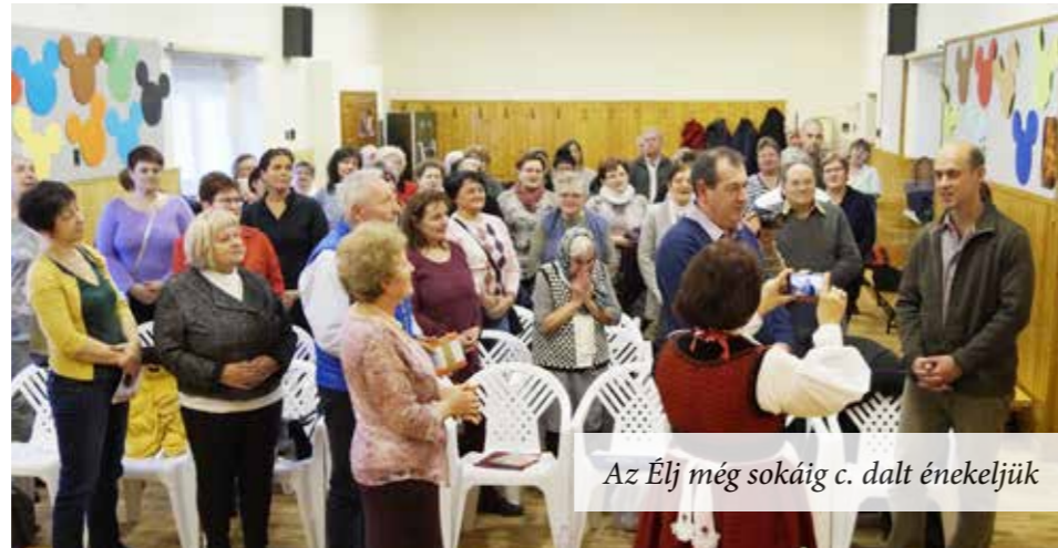
Az Éljen még sokáig c. dalt énekeljük