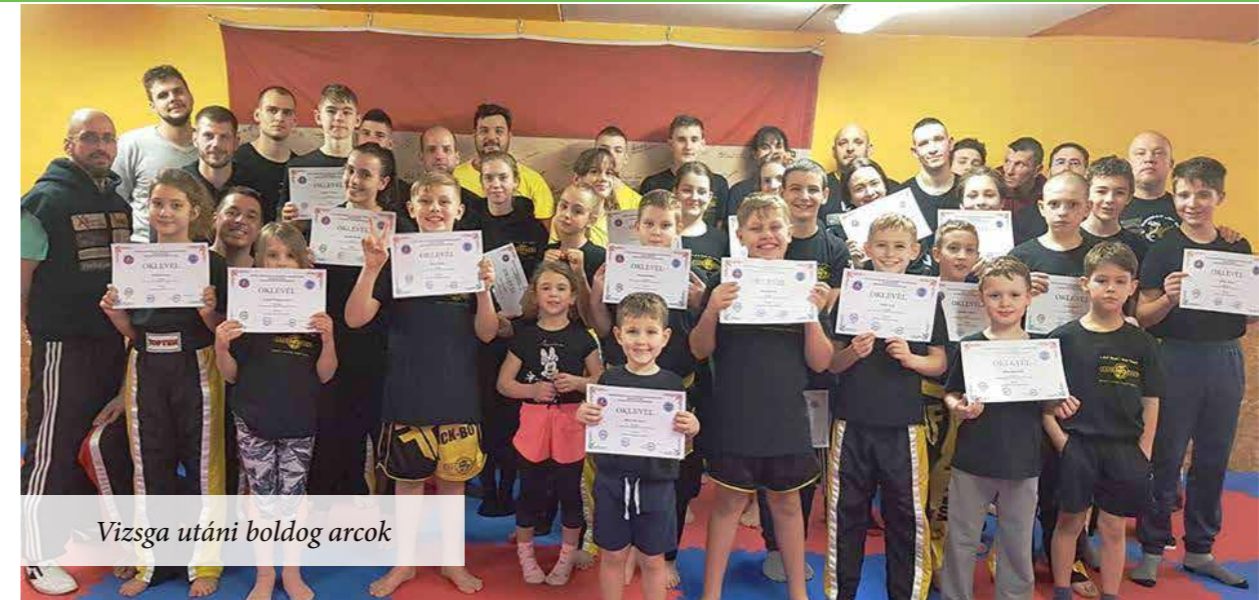
Vizsga utáni boldog arcok