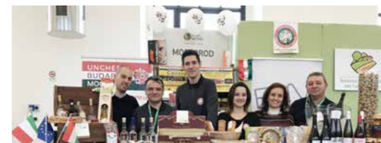
Csapatunk a mogyoródi stand előtt