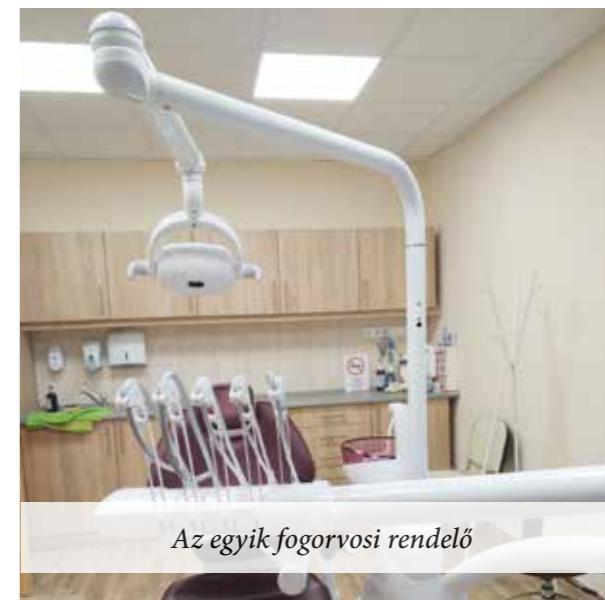
Az egyik fogorvosi rendelő