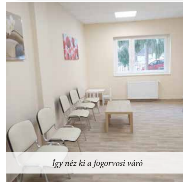
Így néz ki a fogorvosi váró