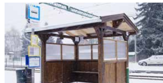
Ezt a buszvárót vette át az Önkormányzat a Turisztikai Kft-től