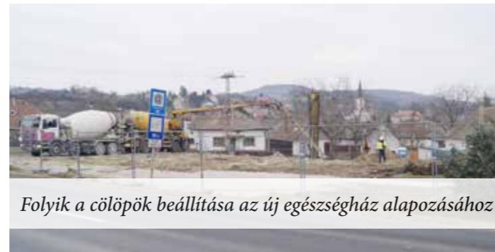
Folyik a cölöpök beállítása az új egészségház alapozásához