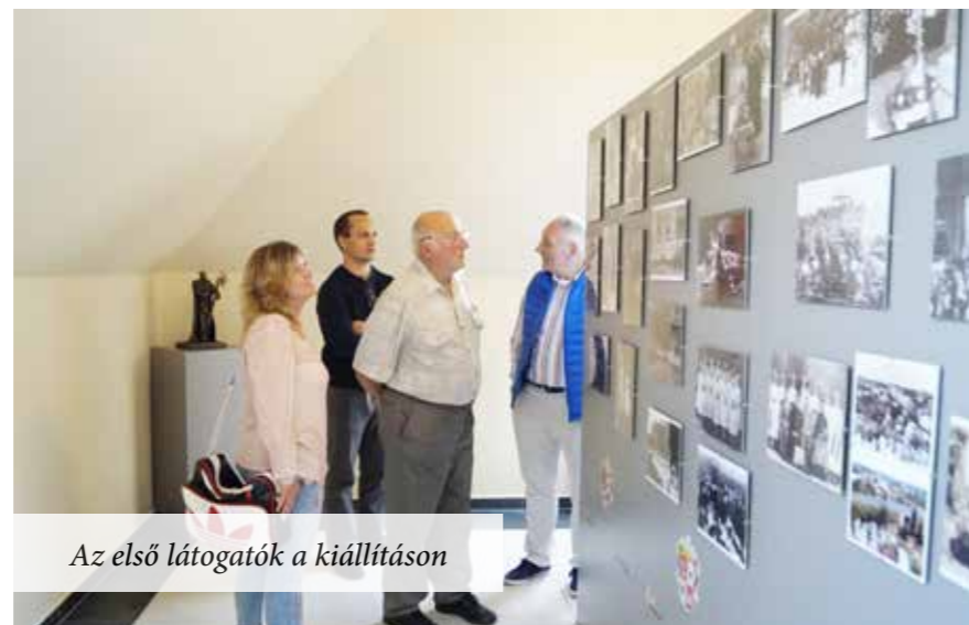
Az első látogatók a kiállításon

A tervek szerint ez a kiállítási anyag az új művelődési házban helyet kap majd, hogy folyamatosan elérhető legyen az érdeklődők számára.