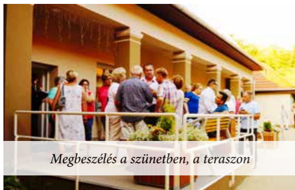
Megbeszélés a szünetben, a teraszon

A megoldás érdekében jelentős költséggel területet vásároltak, arra csereerdőt telepítettek, amit ma is gondoznak, s így kivonható lett a terület az erdő művelési ágból. Szeretnék a 164 telket belterületbe vonatni. Most azonban azzal kerültek szembe, hogy az Önkormányzat döntése szerint meg kellene fizetniük a községfejlesztési hozzájárulás összegét, a négyzetméterenként megállapított 2000 Ft-ot, amit újabb érvágásnak tekintenek, mivel ők csak a kárpótlásban megkapott területüket szeretnék építési telekként hasznosítani. Ezért kéri a községfejlesztési díj elengedését, méltányossági alapon. Ezt 164 mogyoródi család kéri. Az összeg a 700 m 2 -es telkekre újabb kiadásként 1,4 millió Ft lenne, holott ők már áttelepítették az erdőt, leadtak ingyenesen 1,7 ha területet a 16 méteres úthoz, leadtak közösségi területeket, így csökkentek le a telkek mindössze 700 m 2 -esre. A 164 telek után a fenti díjjal számolva 237 millió Ft-ot kellene a berektetőieknek összesen kifizetni.