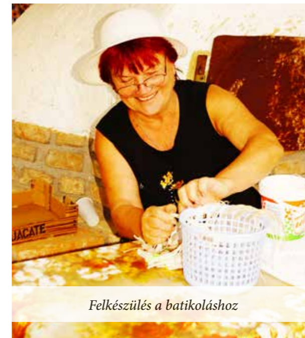
Felkészülés a batikoláshoz