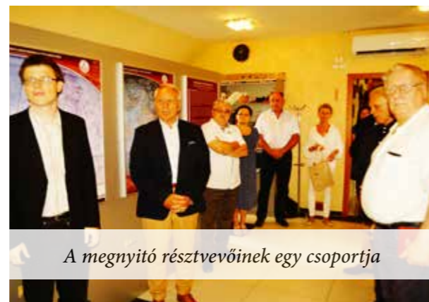
A megnyitó résztvevőknek egy csoportja

Szent László király az egyedüli olyan szent, akinek életét freskóciklusokba foglalták a 13-15. században.