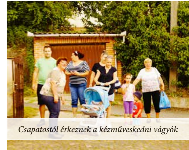
Csapatostól érkeznek a kézműveskedni vágyók