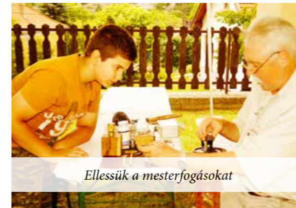
Ellessük a mesterfogásokat