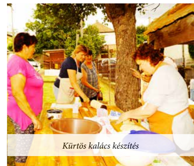
Kürtös kalács készítés