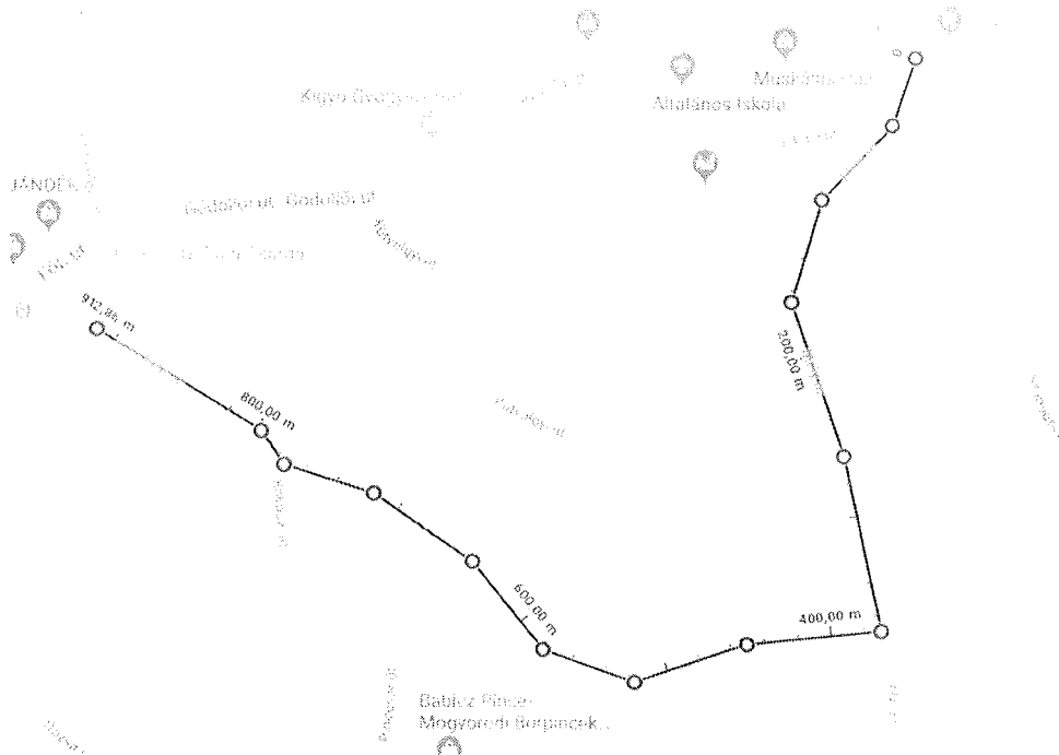
2. ábra