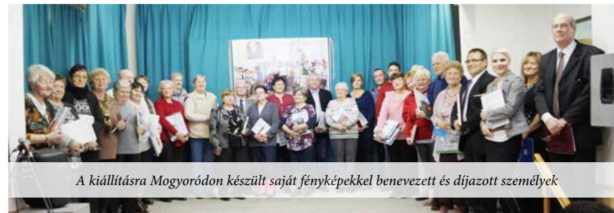
A kiállításra Mogyoródon készült saját fényképekkel benevezett és díjazott személyek