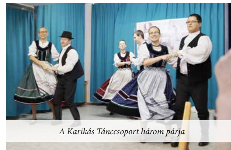
A Karikás Táncsoport három párja