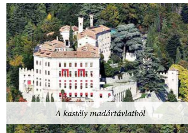
A kastély madártávlatból