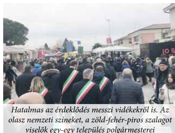
Hatalmas az érdeklődés messzi vidékekről is. Az olasz nemzeti színeket, a zöld-fehér-piros szalagot viselők egy-egy település polgármesterei