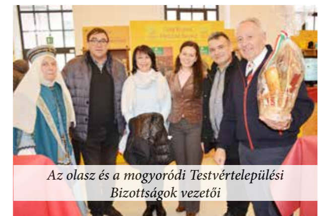
Az olasz és a mogyoródi Testvértelepülési Bizottságok vezetői