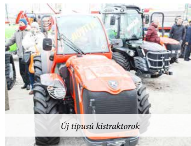
Új típusú kistraktorok