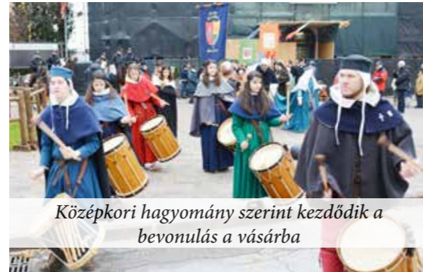
Középkori hagyomány szerint kezdődik a bevonulás a vásárba