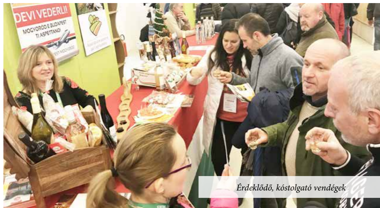
Érdeklődő, kóstolgotó vendégek