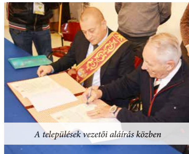
A települések vezetői aláírás közben