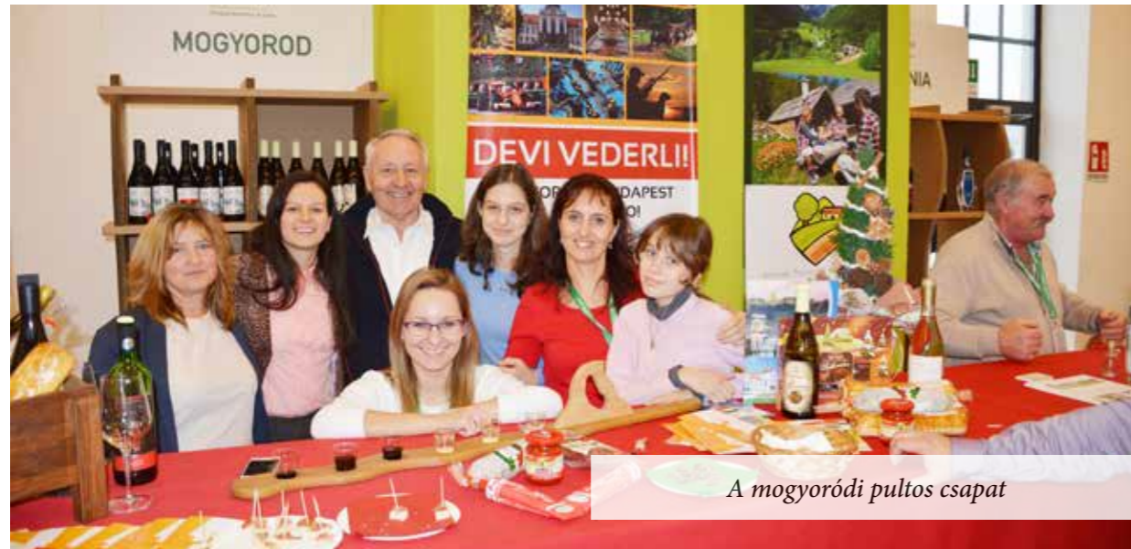
A mogyoródi pultos csapat