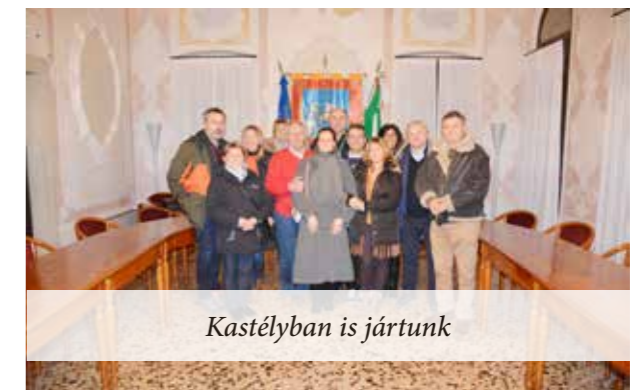
Kastélyban is jártunk