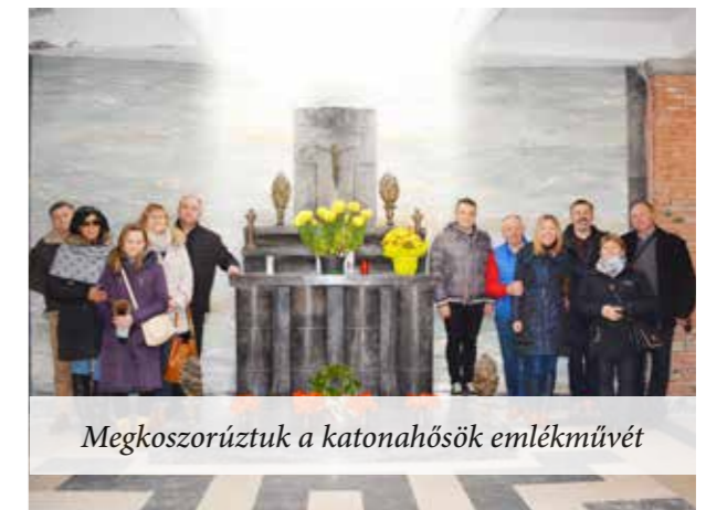
Megkoszorúztuk a katonahősök emlékművét