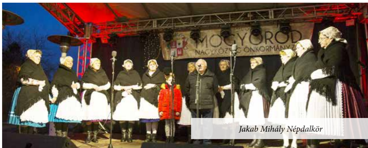
Jakab Mihály Népdalkör