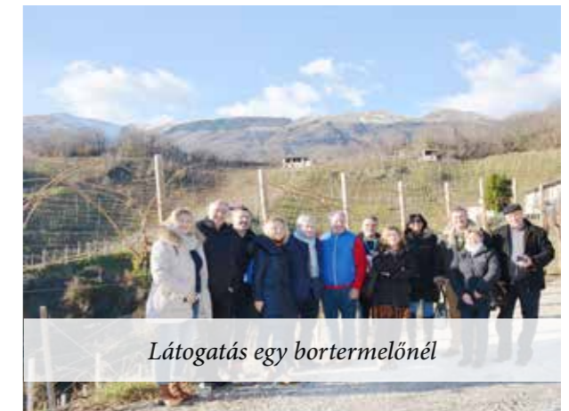
Látogatás egy bortermelőnél