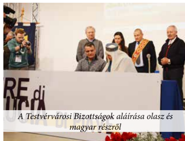
A Testvérvárosi Bizottságok aláírása olasz és magyar részről