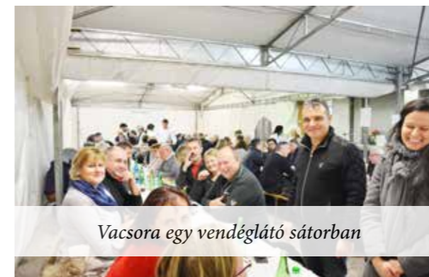
Vacsora egy vendéglátó sátorban