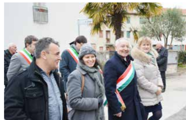
A mogyoródi küldöttség néhány tagja