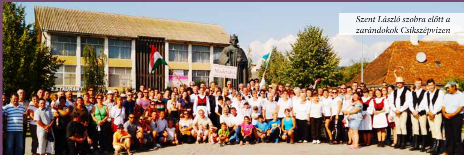
Szent László szobra előtt a zarándokok Csíkszépvízen

kiadvány egy példányát. Visszafelé indulva a hosszú szekéssorról, hol itt, hol ott harsant föl egy-egy nótá hangja. A falvak lakossága többségében kint állt a kapuban, akiknek sűrűn kiáltották oda a szekeresek: „Áztán holnap el ne felejtsek eljönni a madéfalvi Hagymafesztiválra”. Estére érkezünk haza Madéfalvára, éppen egyidőben a hazahajtott tehéncsordával.