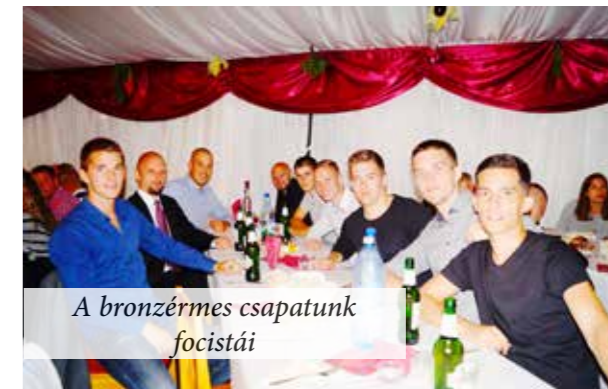
A bronzérmes csapatunk focistái