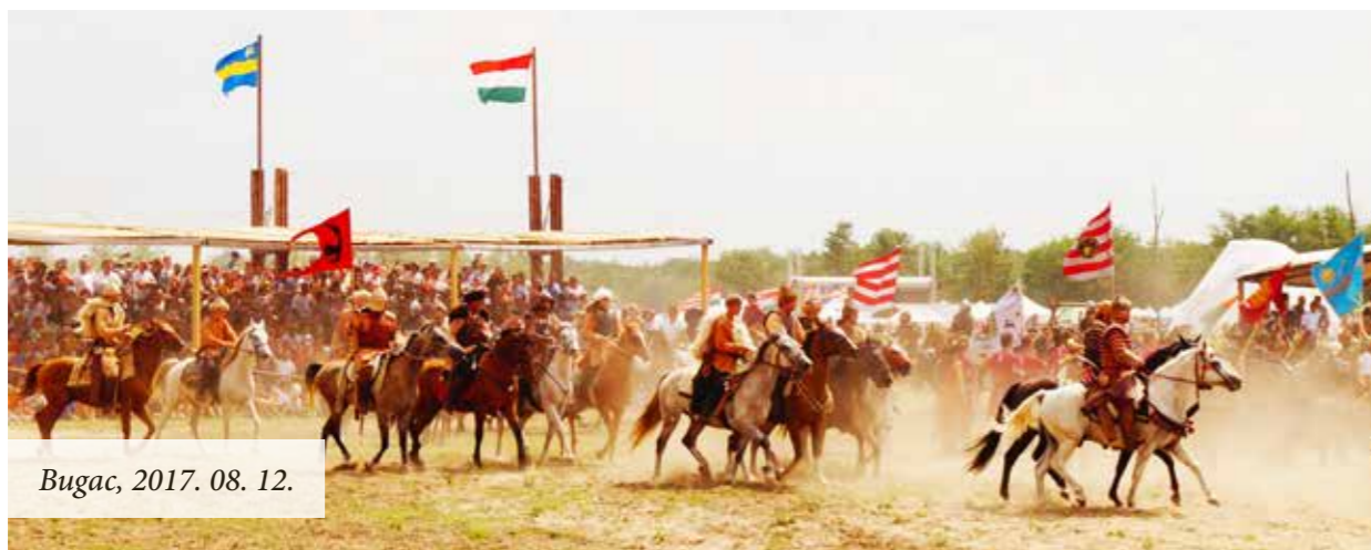
Bugac, 2017. 08. 12.