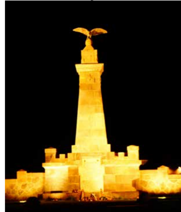
1764. január 7-én, hajnalban, ágyútűzzel és túlerővel támadt a császári katonaság a fegyvertelen, tanácskozásra összegyűlt székelyekre!!!

Hozzávetőlegesen 60 mogyoródi tett eleget Madéfalván, a székely testvértelepülés meghívásának, melyben a több évtizedes kapcsolat alapján látták vendégül községünk lakóit a náluk szokásos Hagymafesztiválon.