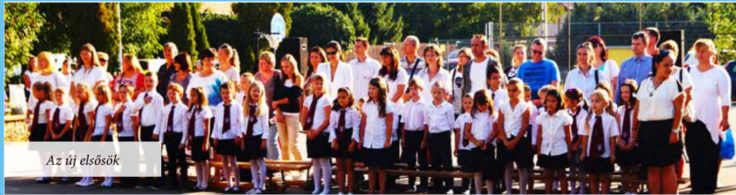
Az új elsősök