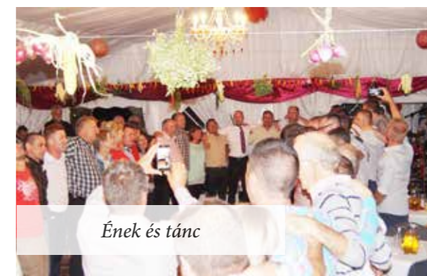
Ének és tánc