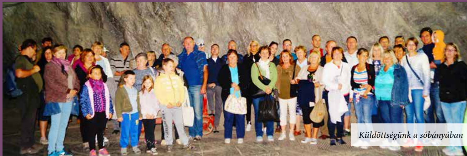
Küldöttségünk a sóbányában