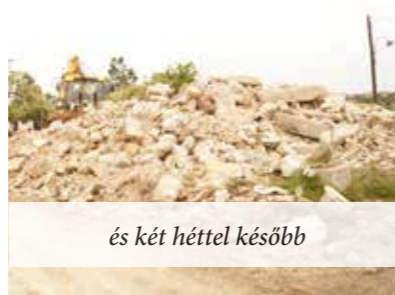
és két héttel később

A Műemlékvédelmi hatóság engedélyezte és szorgalmazta az elbontását a tényleges balesetveszélyre hivatkozva. Ez meg is történt, már a tereprende-