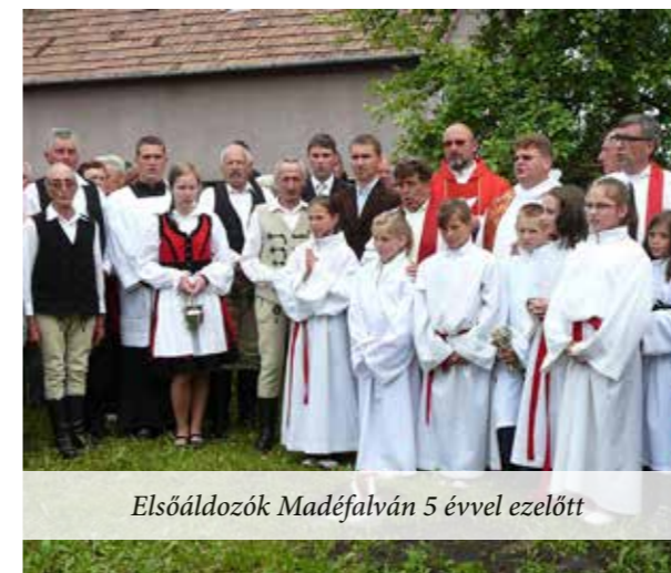
Elsőáldozók Madéfalván 5 évvel ezelőtt