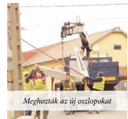
Meghozták az új oszlopokat

A szerződésünk ugyan lejárt az AHK-val, de az érvényes szabályok szerint további fél évig kötelesek elvégezni ezt a szolgáltatást a korábbi feltételek szerint, amíg a közbeszerzési eljárás során új szolgáltatót nem veszi át a földadatot. Az új szabályok szerint viszont már az állam veszi a kezébe ezt az egész országra kiterjedő szolgáltatást, erre hozták létre a Nemzeti Hulladékkezelő Szolgáltató Zrt-t. Viszont még kialakulatlan a helyzet, például a szolgáltatási díjat egyelőre senki sem szedi. Félok, hogy ha június és július hónapban nem tud számlázni egyik cég sem, akkor előfordulhat, hogy augusztusban háromszoros díjat kell majd fizetni visszamenőleg az elvégzett hulladékélszállításért. A szemétünket tehát elviszik, csak a díj beszédése körül van bonyodalom, de ez nem Mogyoród ügye, erre országos szintű megoldást várunk. Kérdés, hogy pénzbeszedés nélkül meddig bírják a hulladékélszállító cégek, mennyi a tőke tartalékuk.