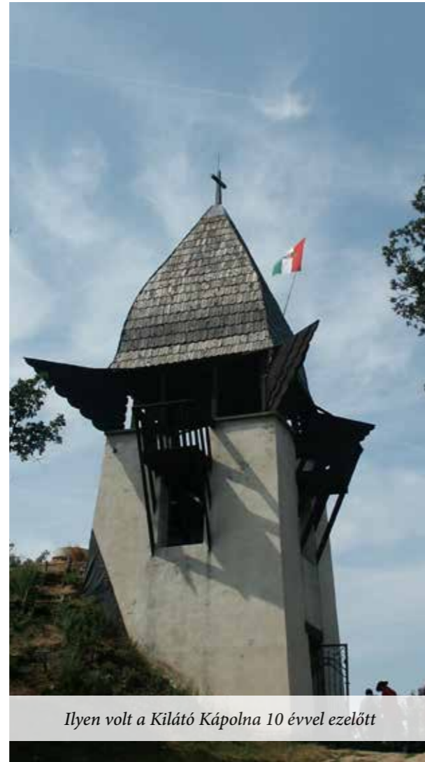
Ilyen volt a Kilátó Kápolna 10 évvel ezelőtt