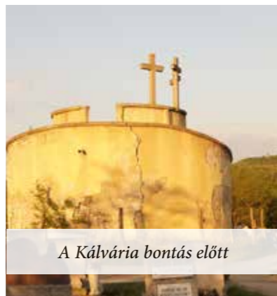
A Kálvária bontás előtt

Elbontották a Kálváriát. Milyen tervek vannak az újjáépítésére?