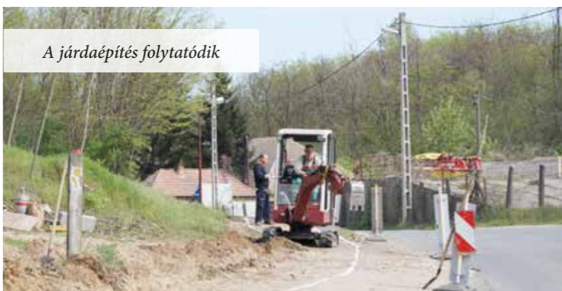
A járdaépítés folytatódik

Szerkesztőségünk javaslata még nem került a képviselő-testület elé, miszerint a Kálvária elbontása során – mivel az kézi erővel történik –, kikerülnek majd ép, egész építőkövek (minden bizonnyal a környéken egykor rendszeresen használt ún. „zöldkő” tömbök), amelyeket kegyeleti és kultúrtörténeti okokból a lakosság meg is vásárolhatna, emlékül. Ez esetben a Kálvária újjáépítéséhez az eladott kövekből befolyó összeg is hozzájárulhatna. A Templomban is őrzünk egy kötömböt a Szent László alapította klastrom épületéből.