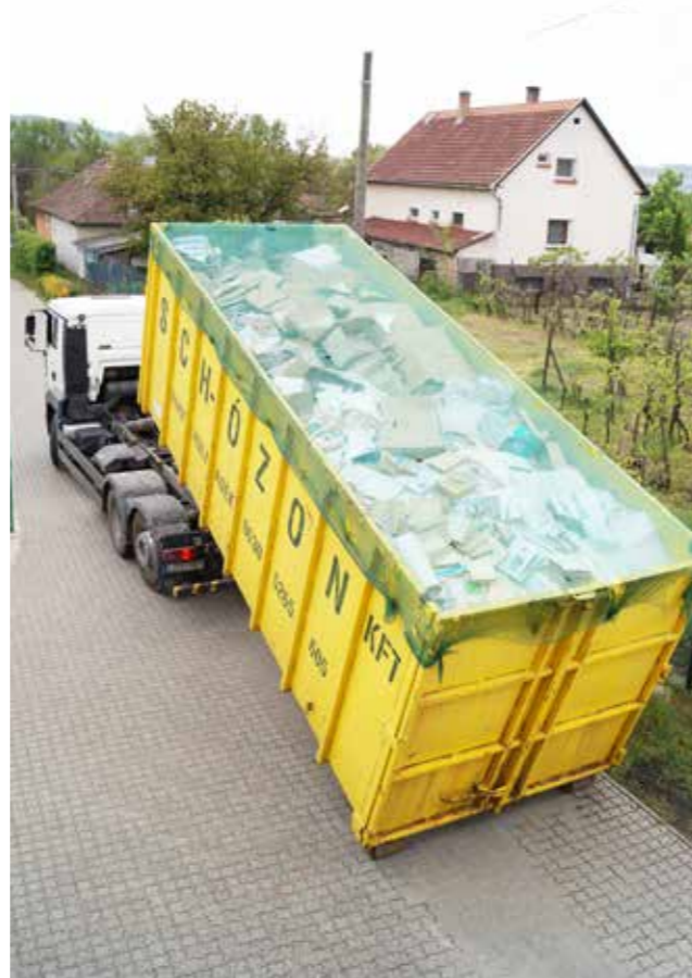
Tréler viszi a konténernyi papírt