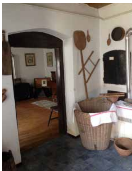
Berendezett konyha régi burkolattal

A faluház korára és állapotára való tekintettel, lehetőségeinkhez mérten felújítási munkákat is végeztünk. A konyhában lévő linóleumot téglaburkolatra cseréltük, illetve megtörtént a konyhai fal javítása és festése, valamint a régi tálalás restaurálása.