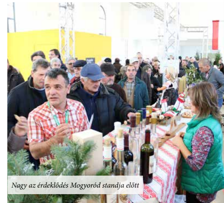
Nagy az érdeklődés Mogyoród standja előtt