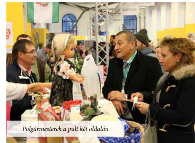
Polgármesterek a pult két oldalán