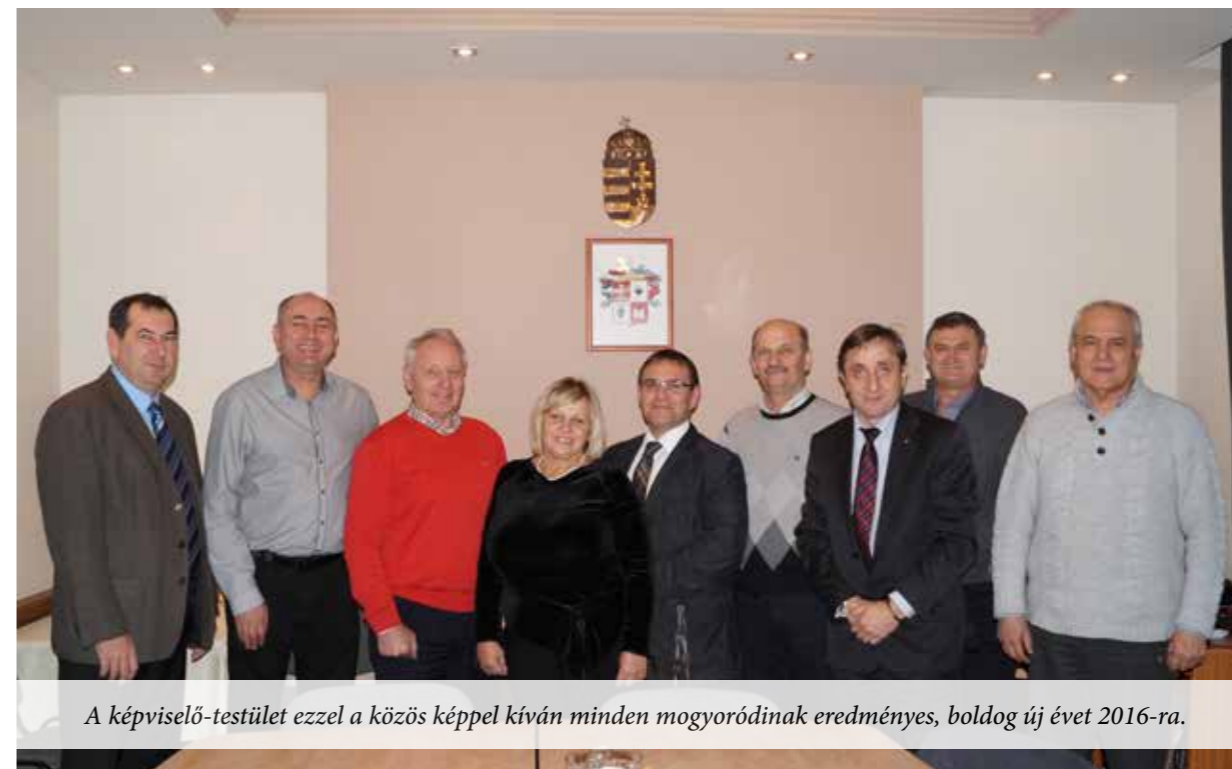
A képviselő-testület ezzel a közös képpel kíván minden mogyoródinak eredményes, boldog új évet 2016-ra.

2011. december 31. Dobronhegy Pintér Örzse