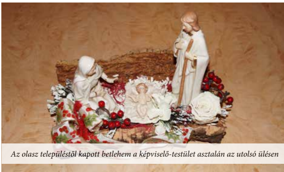
Az olasz településtől kapott betlehem a képviselő-testület asztalán az utolsó ülésen

Elfogadták a képviselők a lejárt határidejű határozatokról szóló jelentést, majd meghallgatták Paulovics Géza polgármester beszámolóját a két ülés közt eltelt időszak fontosabb történéseiről: