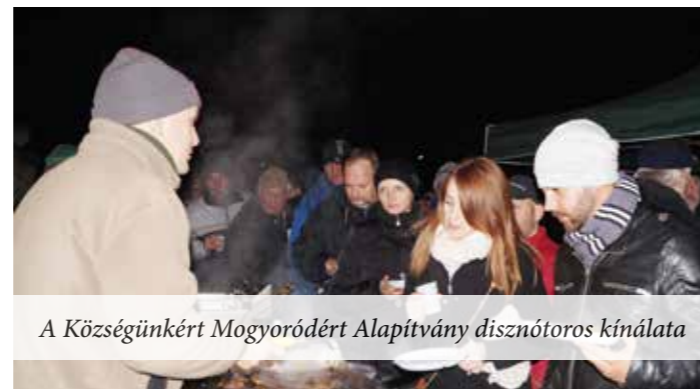
A Községünkért Mogyoróderért Alapítvány disznótoros kínálata