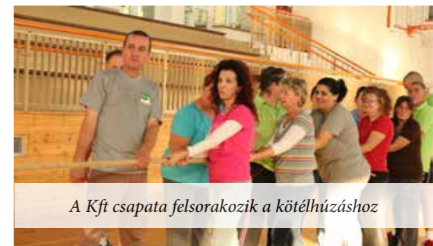
A Kft csapata felsorakozik a kötélhúzáshoz

Többféle sportágban vívtak meg egymással a két csapat versenyzői ezen az újdonságnak tűnő egészségmegőrzést és a mindennapi munka sűrűjéből történő kikapcsolódást célzó, de egyúttal csapatépítésnek is beillő viadalon, melyet a Tornacsarnokban rendeztek, egy novemberi tanítási szüneti napon. A számos fordulatossá, szurkolástól sem mentes versengésben végül a Hivatal nyert a Kft ellen a begyűjtött pontszámok szerint, ám a győztesek hajlandók kiállni jövőre is, hogy a Kft csapata visszavághasson. Az egész napon sportszerű küzdelem zajlott, amit természetesen közösen ünnepeltek meg. Képünkön csak néhány jelenetet tudunk izeltőül bemutatni.