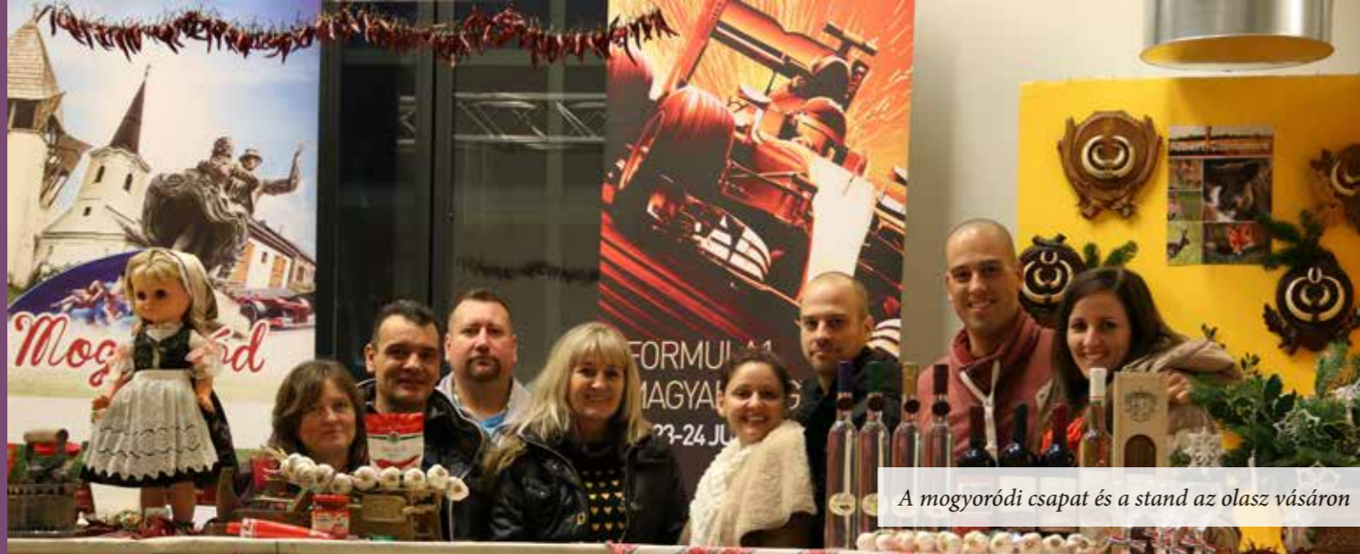
A mogyoródi csapat és a stand az olasz vásáron

Egy új testvér-települési kapcsolat születőben