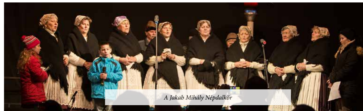
A Jakab Mihály Népdalkör