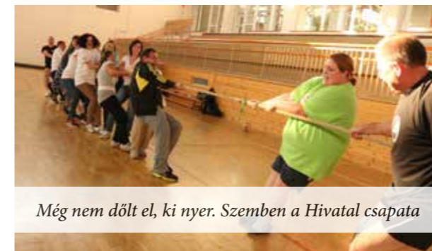
Még nem dőlt el, ki nyer. Szemben a Hivatal csapata